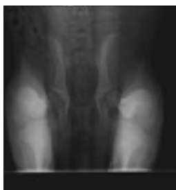
Radiografía distracción PennHip

En la web oficial de PennHip podrá encontrar mas información y localización de veterinarios certificados. research.vet.upenn.edu/pennhip/